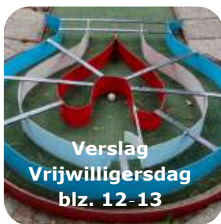
Verslag Vrijwilligersdag blz. 12-13