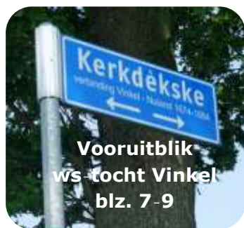
Vooruitblik ws-tocht Vinkel blz. 7-9