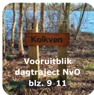
Vooruitblik dagtraject NvO blz. 9-11