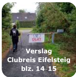
Verslag Clubreis Eifelsteig blz. 14-15