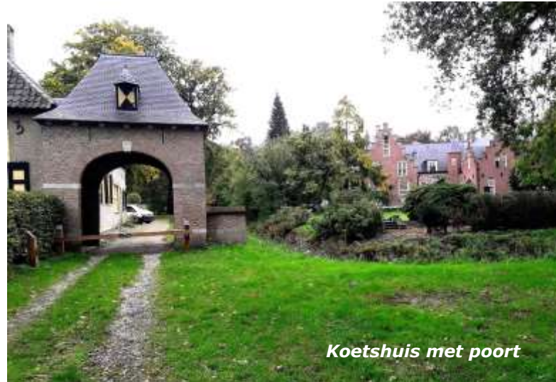
Koetshuis met poort

Deze afstand maakt een bijzondere lus. Zij steken de weg naar Berlicum over en komen in het nieuwe natuurgebied de Rosmalense Aa. Dit is ontstaan na aanleg van het Maximakanaal. Net voor dit natuurgebied, op het erf van een markante boerderij, treffen de wan-